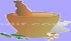
Okhlee(mortar & pestle)